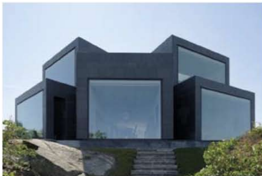
Mot vattnet öppnar huset upp sig med tre av sina karakteristiska tentakler.

Ölandssten Grå G2 som hållar, krönsten och poolavtäckning