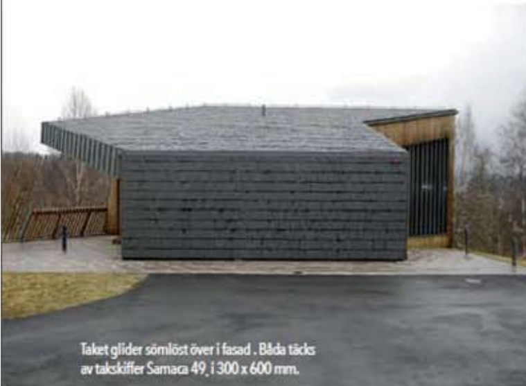
Taket glider sömlöst över i fasad. Båda täcks av takskiffer Samaca 49, 1300 x 600 mm.