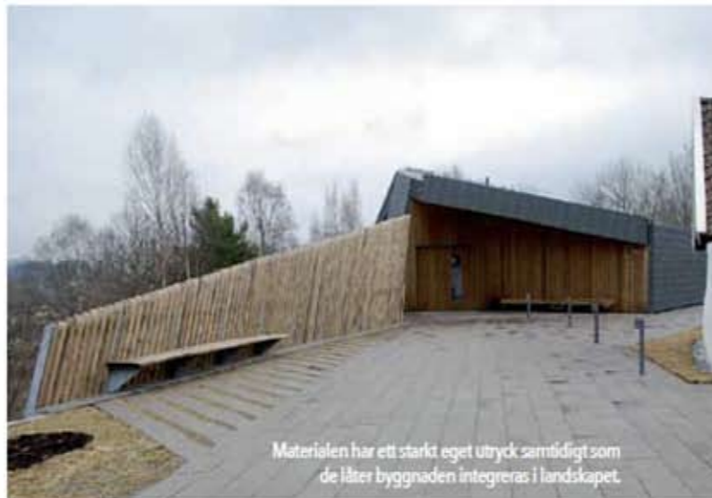
Materialen har ett starkt eget uttryck samtidigt som de låter byggnaden integreras i landskapet.