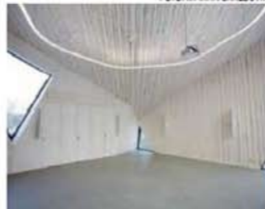
Graniten återfinns både i golvet och i markbeläggningen utanför.