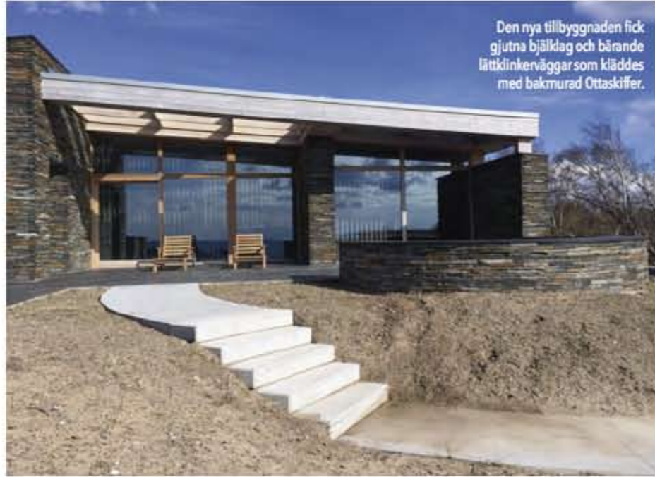
Den nya tillbyggnaden fick gjutna bjälklag och bärande lättklinkerväggar som kläddes med bakmurad Ottaskiffer.